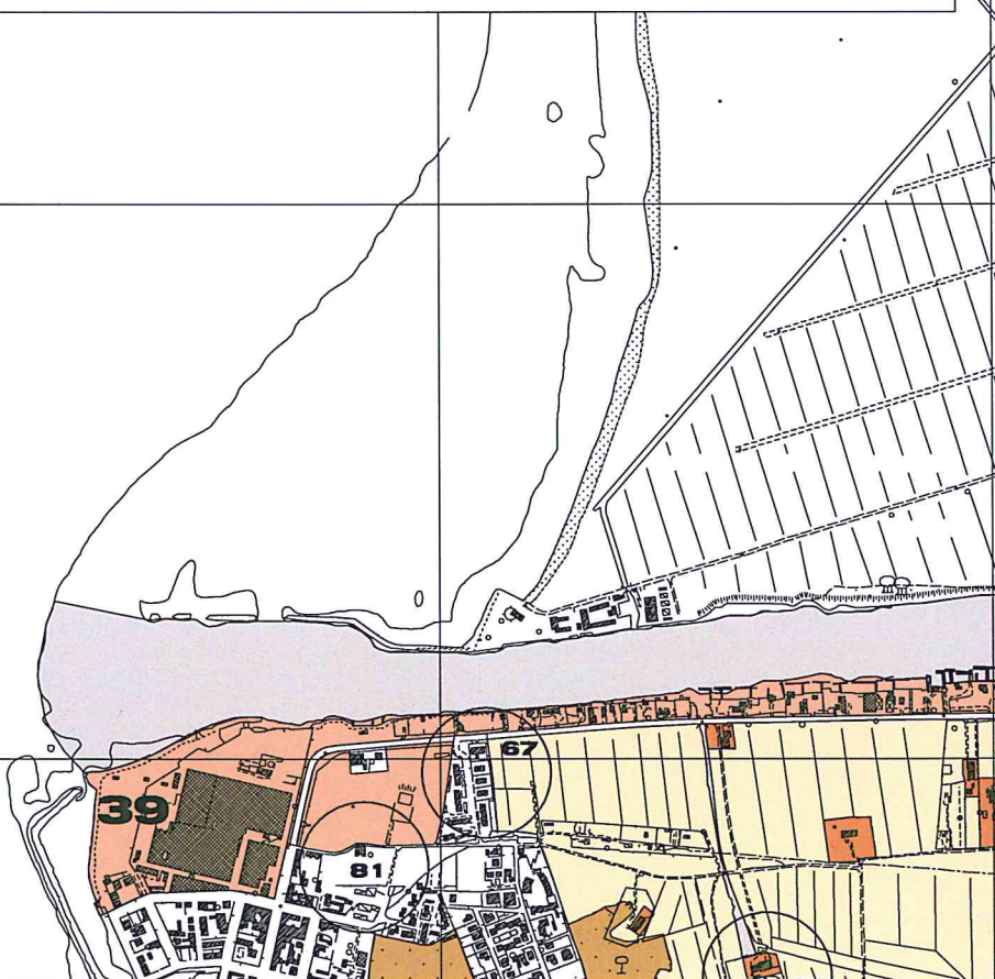
Tavola n. 1a